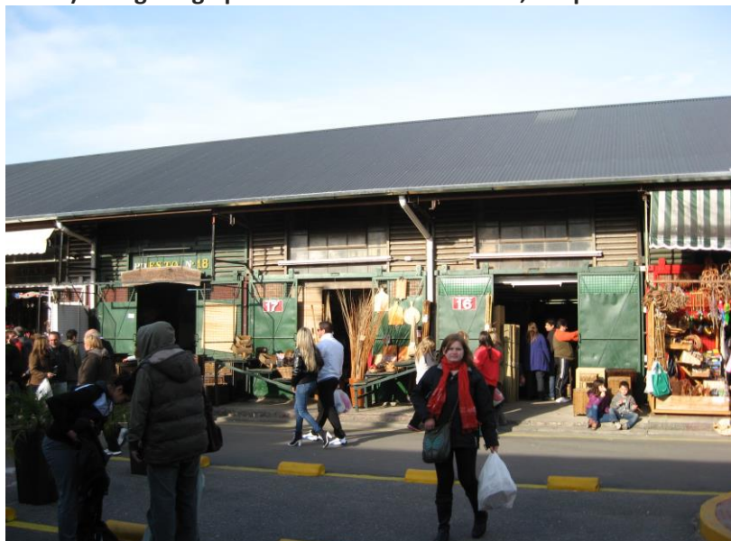
Foto 2: Puestos de venta de productos típicos de las islas del Delta.